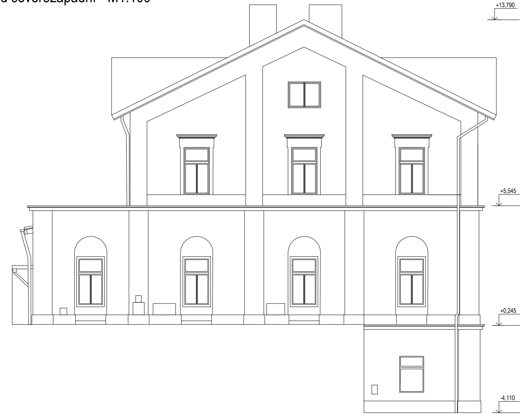
Pohled severozápadní - M1:100