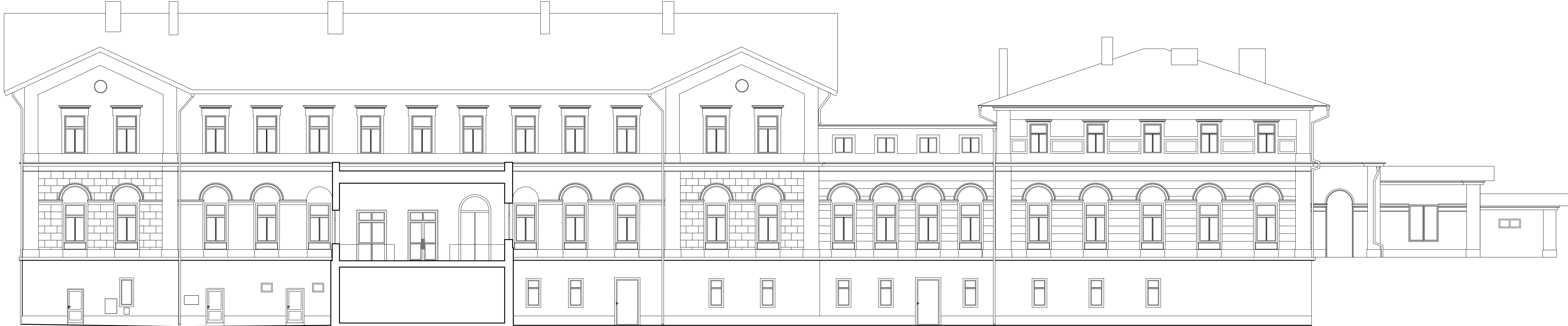
Pohled jihozápadní - M1:100