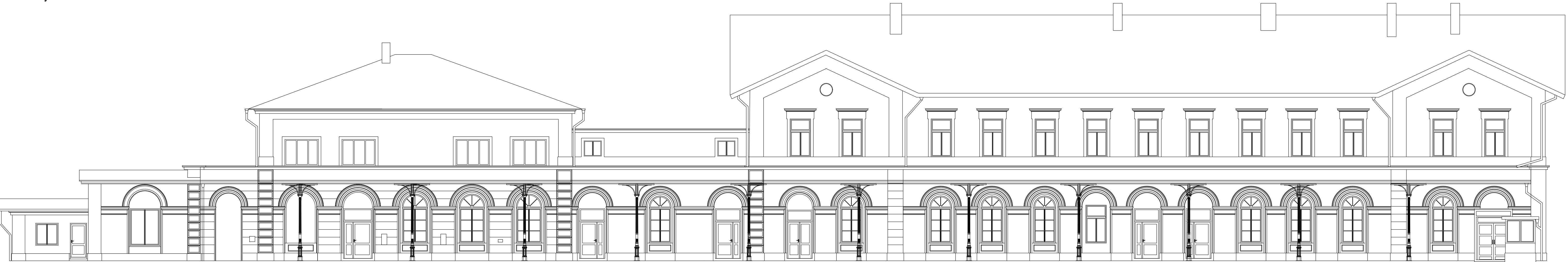
Pohled severovýchodní - M1:100